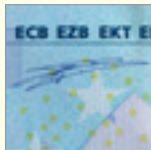
Willem F. Duisenberg